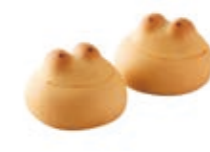
青蛙馒头 (Kaeru Manjyu)