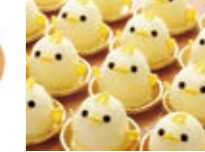
小鸡布丁蛋糕 (Piyorin Cakes)