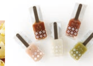
外郎糕棒 (Uiro Bars)