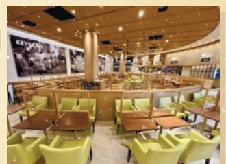
広々としたイトインスペース