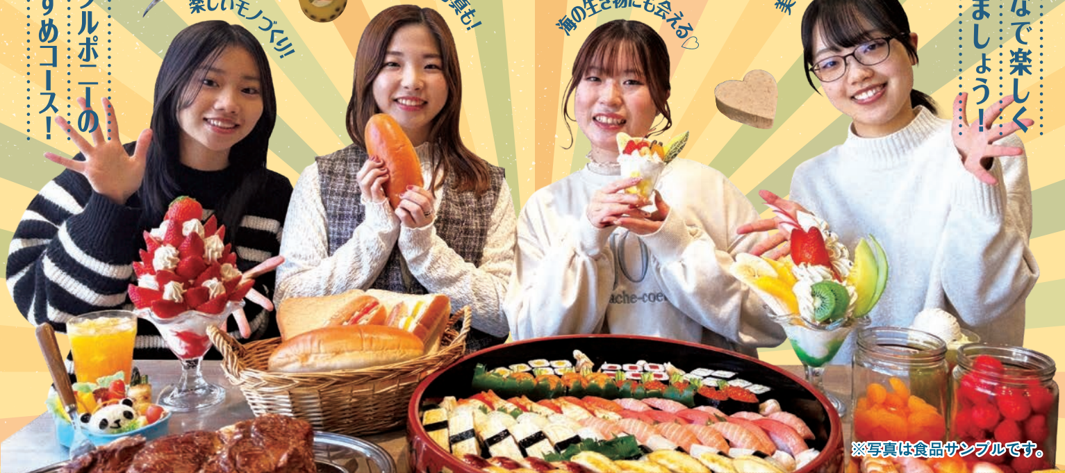
※写真は食品サンプルです。