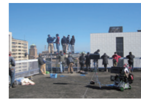
映画「亜人」撮影風景

●映画「亜人」では官庁街を封鎖。400名を超えるボランティアエキストラの協力でパニックになった市街地の撮影を実施。 ●映画「三度目の殺人」の撮影が名古屋市役所で行われ、ドラマ「ガリレオ」・映画「SCOOP!」に続き、福山雅治さん主演作品への3度目となる支援となった。