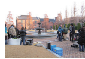
映画「WAYA! 宇宙一のおせっかい大作戦」撮影風景