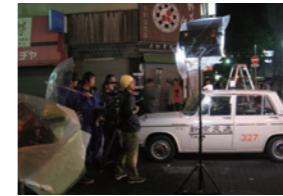
TBS「運命の人」撮影風景