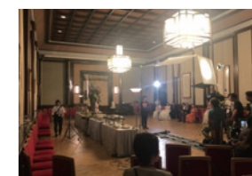
映画・ドラマ「明治東京恋伽」撮影風景