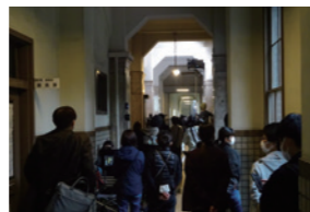
映画「ノイズ」撮影風景