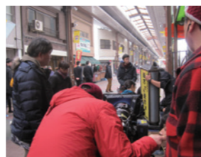
映画「寄生獣」撮影風景