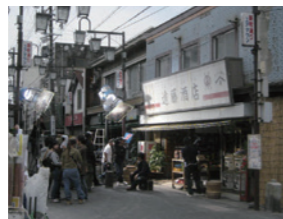
映画「20世紀少年」撮影風景