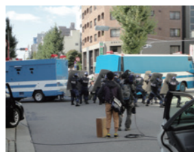
TBS「最後の警官」撮影風景

●名古屋市出身の小説家大島真寿美原作の映画「チョコリエッタ」の撮影では、偶然にもご自身の出身高校でのロケが実現。