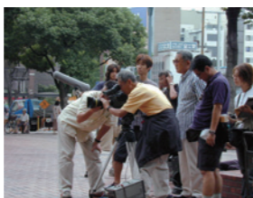
日本テレビ「下町・銭湯騒動記」撮影風景