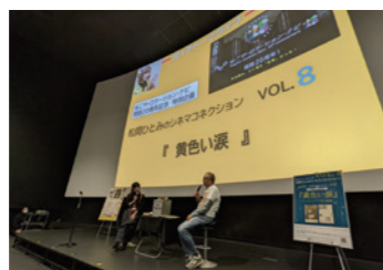
20周年企画「黄色い涙」上映&トーク