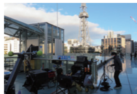
NETFLIX「新聞記者」撮影風景