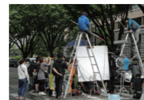
映画「ストロベリーナイト」撮影風景