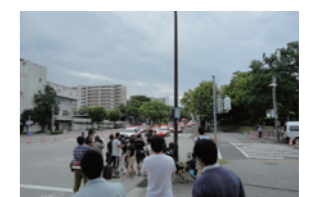
映画「藁の楯」撮影風景