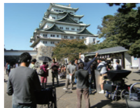
映画「築城せよ!」撮影風景