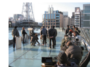
TBS「税務調査官・窓際太郎の事件簿」撮影風景