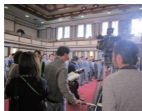
テレビ朝日「オリンピックの身代金」撮影風景