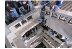
映画「ステキな金縛り」撮影風景