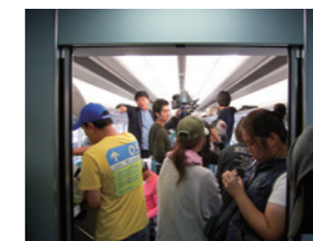
韓国ドラマ「Someday」撮影風景