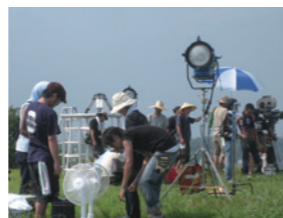
映画「心中天使」撮影風景