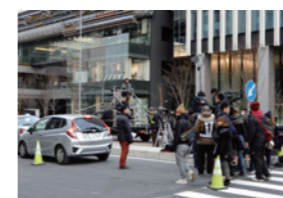
映画「AI崩壊」撮影風景

●名古屋市内を中心に全編愛知県内で撮影された日韓合作映画「デッドエンドの思い出」では、納屋橋・円頓寺商店街など名古屋らしい場所で多数撮影。久屋大通公園でのシーンは、改修前の風景が映っており、貴重な作品となった。 ●映画「AI崩壊」では、ささしまライブのアンダーパスを2日間完全封鎖して大迫力のカーアクションシーンを実施。名古屋での撮影期間の3日間で延べ400人以上のボランティアエキストラにご協力いただく。