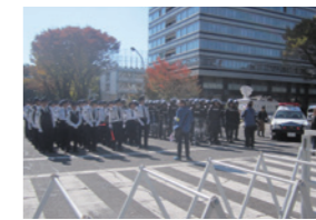
映画「亜人」撮影風景