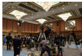
映画「午前0時、キスしに来てよ」撮影風景