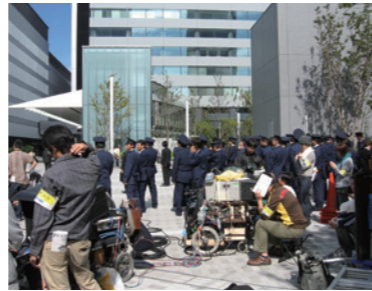
映画「クロサギ」撮影風景