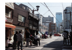
映画「デッドエンドの思い出」撮影風景