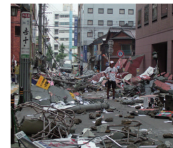
映画「小さき勇者たち～ガメラ～」撮影風景