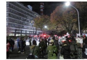
ドラマ「都庁爆破!」撮影風景