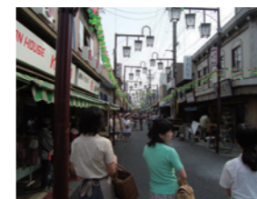
映画「黄色い涙」撮影風景