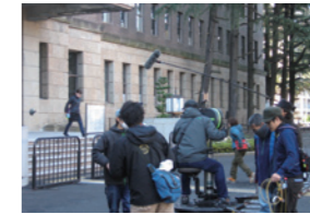
映画「終の信託」撮影風景