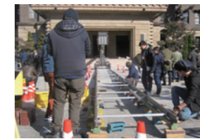
映画「三度目の殺人」撮影風景