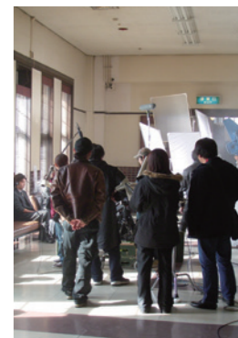
映画「ミラクルバナナ」撮影風景