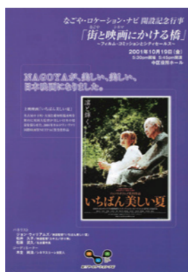
開設記念行事チラシ