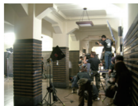
TBS「官僚たちの夏」撮影風景