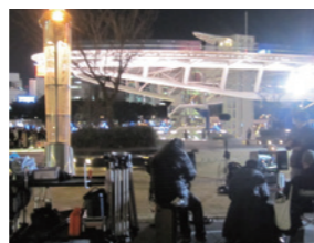
映画「ピリギヤル」撮影風景