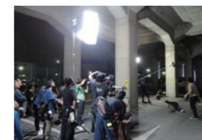
映画「俺俺」撮影風景