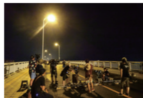
映画・ドラマ「太陽は動かない」撮影風景