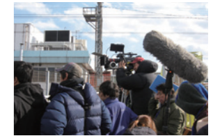
韓国映画「僕の妻のすべて」撮影風景