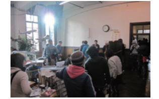
映画「ALWAYS三丁目の夕日'64」撮影風景