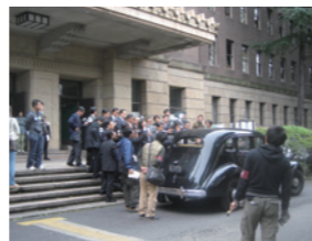
NHK「白洲次郎」撮影風景