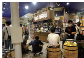
映画・ドラマ「ヴィレヴァン」撮影風景