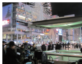
映画「ピリギヤル」撮影風景

●映画「ピリギヤル」の撮影が行われ名古屋が舞台の代表的な作品となった。 ●映画「龍三と七人の子分たち」では、大村知事、河村市長が舞台挨拶する特別試写会を109シネマズで実施。トーク中盤からは北野武監督がサプライズゲストとして登壇。