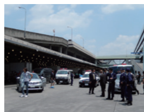
映画「龍三と七人の子分たち」撮影風景