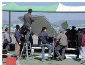
映画「ドラッグストア・ガール」撮影風景