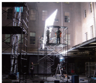
映画「笑の大学」撮影風景