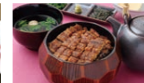
ชิสึนาชิ