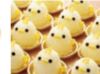
ปิโยรินเค้ก