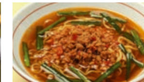
ไต้หวันรามเม็น