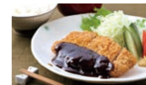
มีโซะคัตสึ

นาโกย่าเป็นสมรภูมิแห่งอาหารที่มีชื่อเสียงด้วยวัฒนธรรมอาหารที่เป็นเอกลักษณ์ไม่เหมือนใคร ถึงขนาดที่มีคำเรียกขานเฉพาะว่า "นาโกย่าเมชิ" หรืออาหารท้องถิ่นสไตล์นาโกย่า เมนูอาหารของที่นี่มีหลากหลายชนิดด้วยกัน ตั้งแต่มีโซะ-คัตสึ และชิสึนาชิ เกบะซากิ และไต้หวันรามเม็น ไปจนถึงอาหารเช้าสไตล์นาโกย่า และขนมหวานขึ้นชื่อลงแวงมาสัมผัสกับเมนูพิเศษเสิร์ฟที่หาชมได้เฉพาะในนาโกย่าเท่านั้น