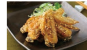
เกบะซากิ