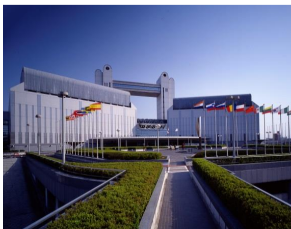
<名古屋国際会議場>

(公財) 名古屋観光コンベンションビューローとは・・・ 名古屋市及びその周辺地域の産業・技術・文化・歴史等の資源を活用し、MICE（国際会議、全国規模の大会など）・観光・イベントの振興を図り、地域の産業経済の活性化、文化の向上、国際相互理解を増進することを目的として各種事業を展開しています。