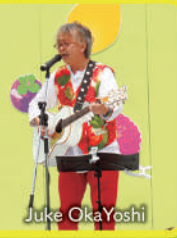
ハーラウ ナーレイオ カイホラウアエ