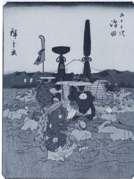
人物東海道《五十三次 嶋田》 嘉永(1848-54)未頃 墨中判錦絵