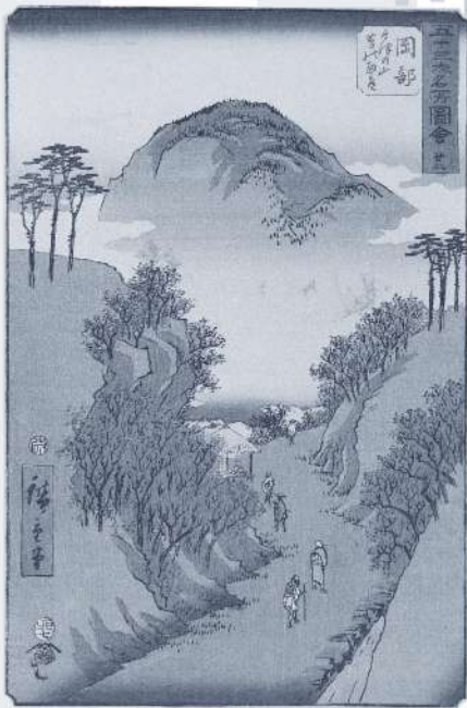
墨絵東海道《五十三次名所図会 岡部 宇津の山髯の細道》 安政2年(1855) 墨大判錦絵