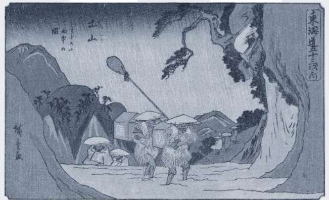
行書東海道《東海道五十三次之内 土山 すゞか山雨中の図》 天保12、13年(1841、42)頃 横間判錦絵

本展では、歌川広重が描いた各種の東海道シリーズの中から、東海道随一の難所と名高い箱根の山々や大井川、旅人の往来を厳しく取り締まった関所、さらには旅人を悩ませた悪天候など、旅路の難所を描いた作品を通して、人々がどのような覚悟で旅を続けたかに迫ります。難所を無事に越えた先には、どんな景色が広がっていたのでしょうか。