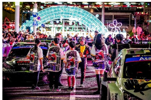
昨年のオープニングセレモニーの様子