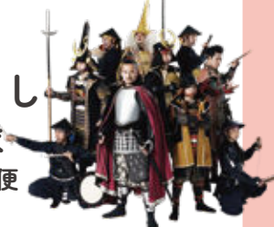
名古屋おもてなし武将隊®