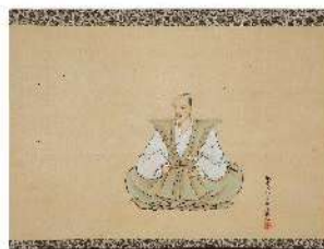
織田信長画像掛軸(狩野永徳筆)