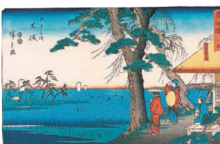
東海道 九 五十三次 大磯(隸書版)