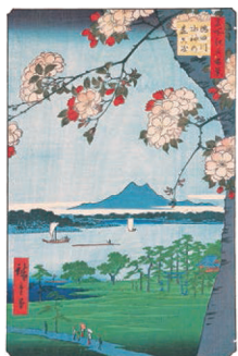
名所江戸百景 隅田川 水神の森真崎