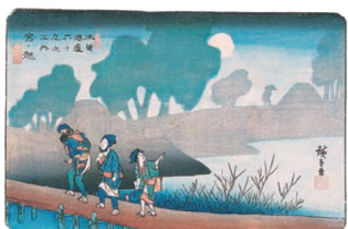
木曾海道六拾九次之内 宮ノ越