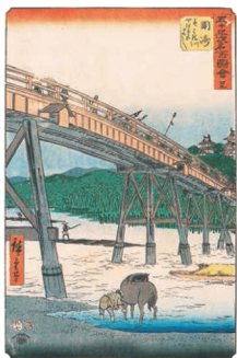
五十三次名所図会 廿九 岡崎 矢はき川やはきはし (絵巻東海道)