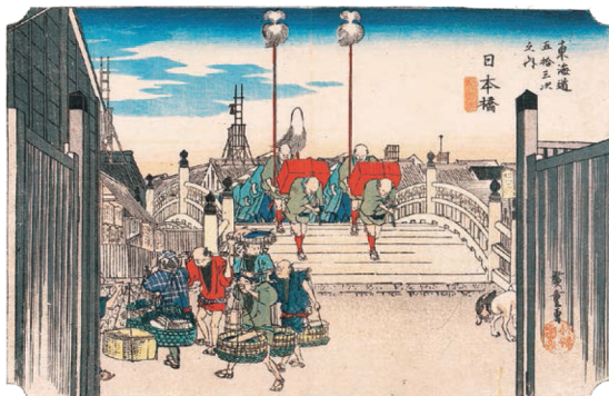
東海道五拾三次之内 日本橋 朝之景(保永堂版)