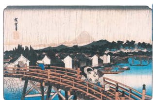
東都名所 日本橋之白雨