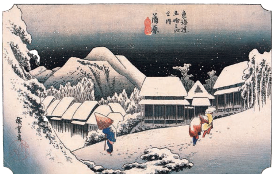
東海道五拾三次之内 蒲原 夜之雪(保永堂版)