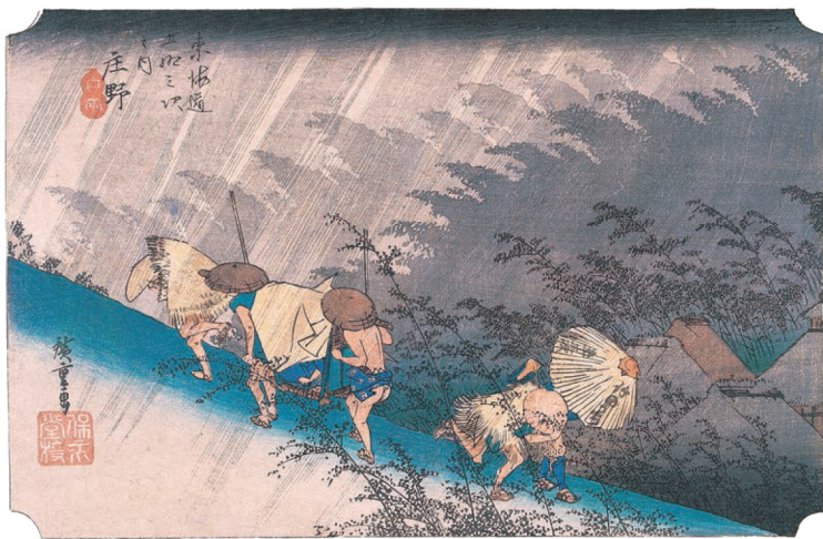
東海道五拾三次之内 庄野 白雨(保永堂版)

風景画の名手歌川広重の代表作である保永堂版「東海道五拾三次之内」全55図に加え、行書版、隸書版、絵巻東海道などの各種東海道絵や、広重のもうひとつの代表的街道絵である「木曾海道六拾九次之内」から作品を紹介いたします。 また、江戸や近江などの名所絵もあわせて紹介し、広重の風景画の世界をすぐれた個人コレクションとともに堪能いただけます。