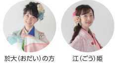
於大(おだい)の方 江(ごう)姫

◆ゲスト乗船時間：11/21(日)11:00~15:00の一部便 ◆ゲスト乗船区間：尾頭橋親水広場 ⇄ 白鳥