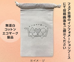
無漂白 コットン エコマーク 製品

キャンペーンに参加の上 いずれかのフェア会場へ来場 された方、各日先着50名様に 「エシカル×あいち」 ミニコットン巾着を プレゼント