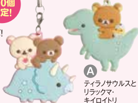
A ティラノサウルスとリラクマ・キョロイトリ