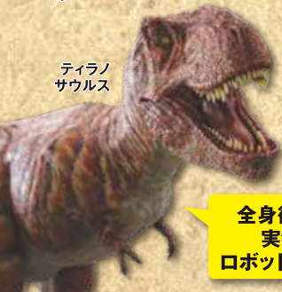
ティラノサウルス