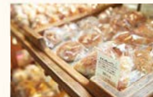
新窯パン専門 ダーシェンカ 蔵