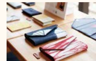
革絞り専門店 くくる