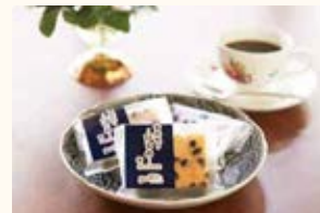
洋菓子 グランパニエ