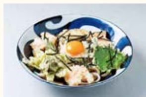
手打ちめん処 寿限無茶屋