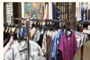
しぼりの久田本店