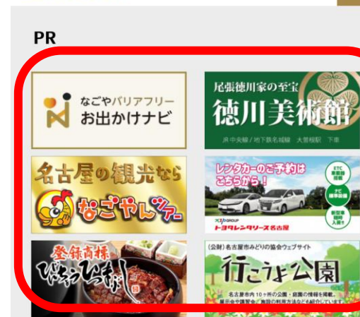
名古屋コンシェルジュ バナー広告