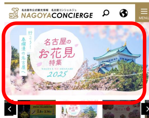
名古屋コンシェルジュ TOPスライド広告

👉 ポイント 旬の情報や、話題のイベント、人気スポットの特集など名古屋観光に役立つ情報が充実。