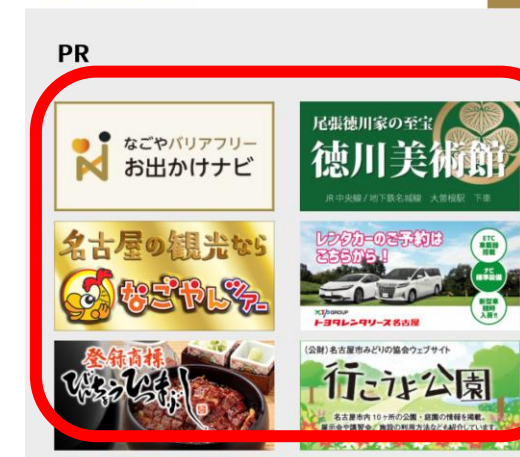
名古屋コンシェルジュ バナー広告