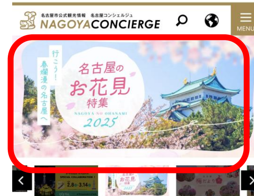
名古屋コンシェルジュ TOPスライド広告

👉 ポイント 旬の情報や、話題のイベント、人気スポット の特集など名古屋観光に役立つ情報が充実。