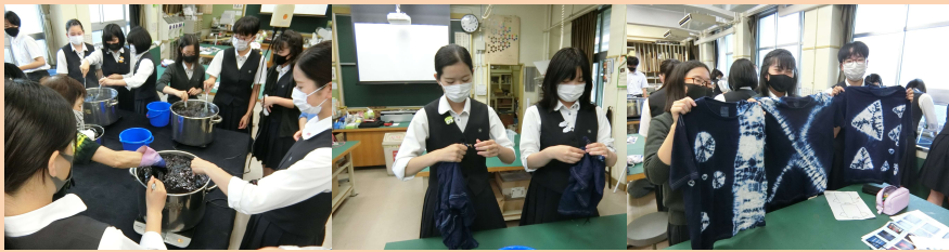
染料に数分間浸し、水でしっかり洗い流してから、紐をほどけば…完成です！