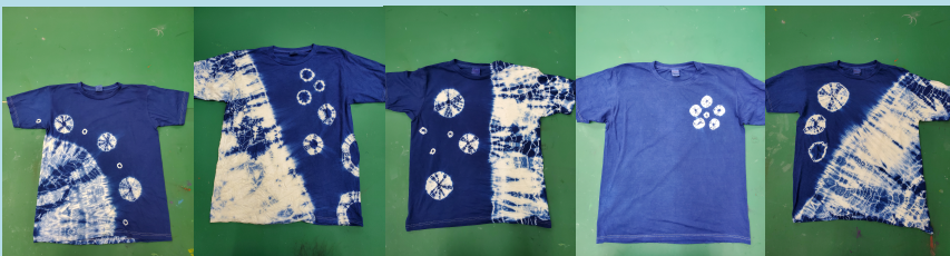
そして選ばれたのはこの5点！最終選考は観光案内所の方に委ねられます…。