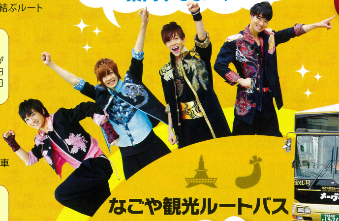
なごや観光ルートバス