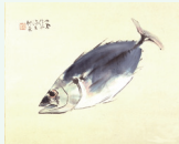
竹内栖鳳 「松魚」 古川美術館蔵

5月18日(土)～6月30日(日) — 古川美術館 — 美術作品 の“色”に着目し、洋画・日本画を中心に、色をもたらすイ メージ、心理的メッセージや主題の意味合いをより強く印象 付ける色、作家の思いや思考を表す色など、色彩がもたらす 様々な視覚的、心理的効果を読み解く。 ☎1,000円ほか ☎☎☎38頁参照 ☎☎763-1991 http://www.furukawa-museum.or.jp/