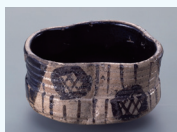
黒織部茶碗 銘「板莊」(桃山時代)