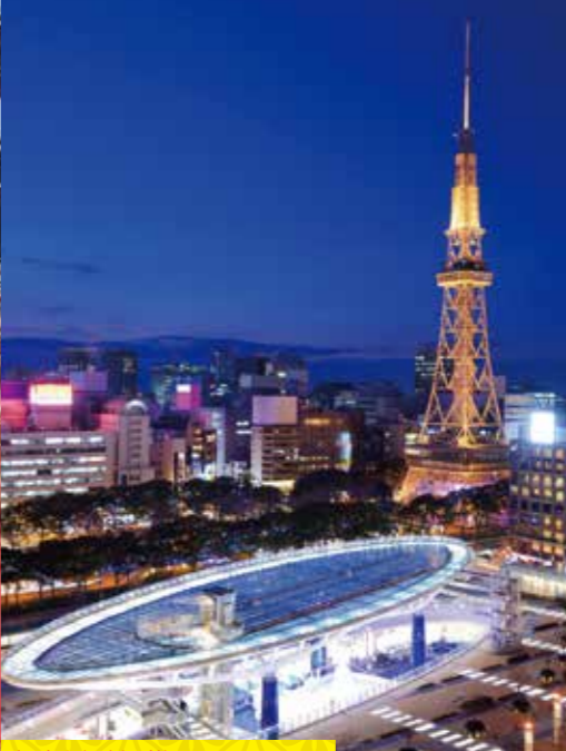
名古屋電視塔 綠洲21